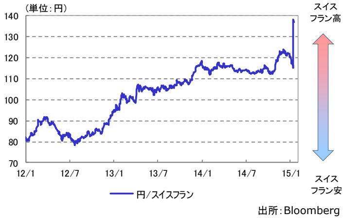
スイスフラン為替レート(対円) 2012/1/2~2015/1/16