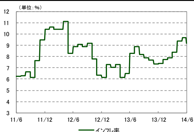
インフレ率の推移 2011/6/30～2014/6/30