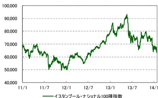
株式市場の推移 2011/1/3 ~ 2014/1/28