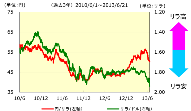
＜為替レートの推移＞