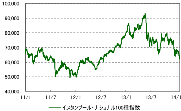
株式市場の推移 (過去3年) 2011/1/3 ~ 2014/1/29