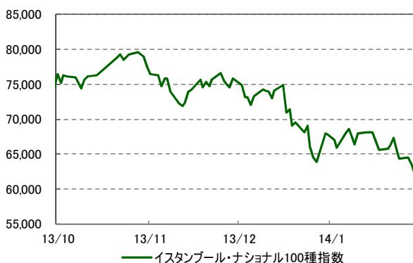
株式市場の推移 (過去3ヵ月) 2013/10/1 ~ 2014/1/29