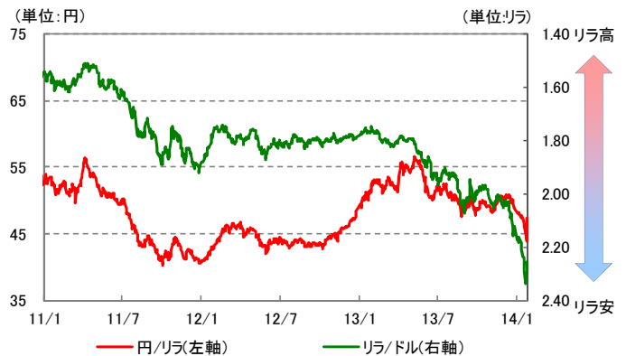
為替レートの推移 (過去3年) 2011/1/4 ~ 2014/1/30