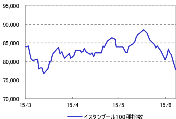
株式市場の推移 (過去3ヶ月) 2015/3/1~2015/6/8