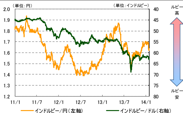
為替レートの推移 2011/1/3～2014/1/28