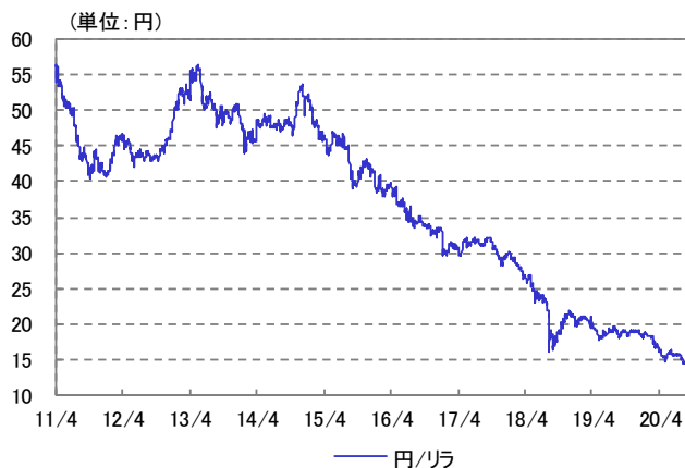
トルコ・リラ 為替レート 2011/04/01~2020/08/31