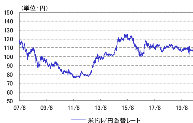
米ドル/円 為替レート 2007/08/13~2020/08/31

※ 設定時2007年8月13日を10,000として指数化しています。 ※ 2016年8月23日まではドイツ銀行グループ商品指数(円建て為替ヘッジなし)を、2016年8月24日からはCRB指数(円建て為替ヘッジなし)を指数化しています。