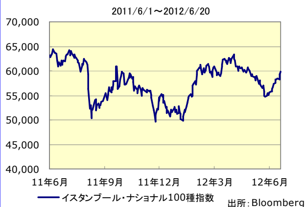
<主要株式指数の推移>