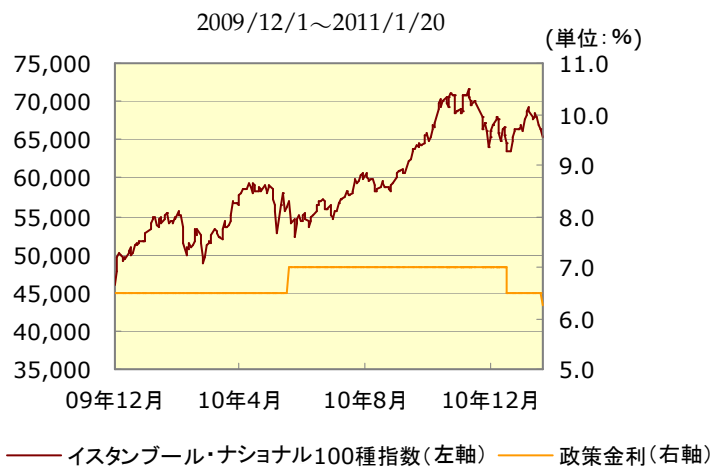
＜トルコ株価指数および政策金利の推移＞

※グラフは、Bloombergその他信頼できる情報をもとに、損保ジャパン日本興亜アセットマネジメントが作成