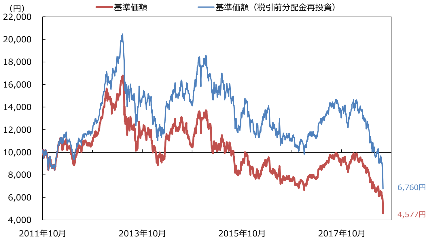
【当ファンドの基準価額の推移と期間別騰落率】

なお、当ファンドは 8月15日(水)から8月27日(月)まで トルコの休日（犠牲祭）などに伴う「 お申込み不可日 」となりますのでご留意下さい。